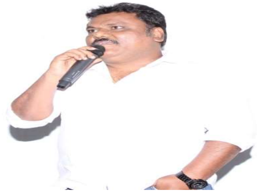
Chief guest speech on 15.02.2019