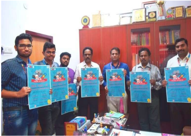
Poster release of the event 15.02.2019