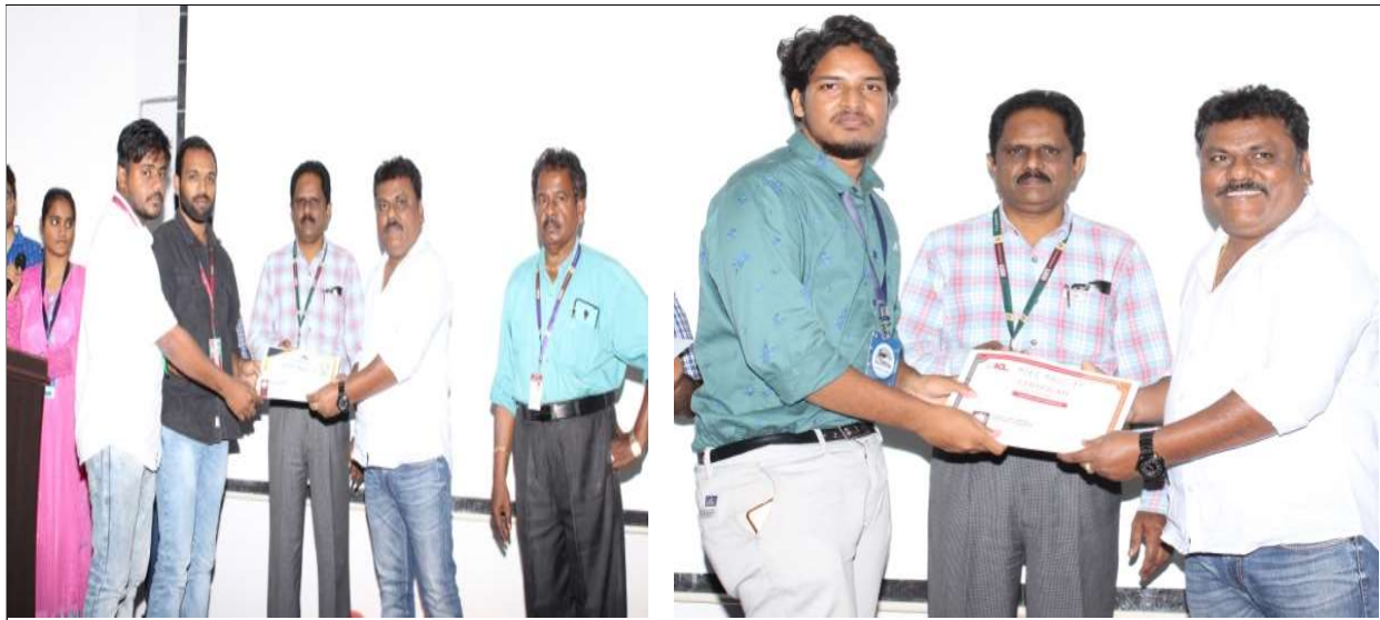
Participants receiving certificates on 15.02.2019